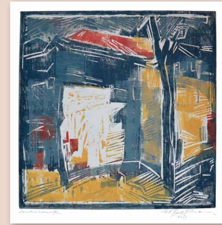
Uwe Beckmann, »Hausecke«, Farbholzschnitt, 2011