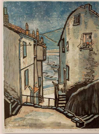
Otilie Ehlers-Kollwitz, »Hafen von Calvi«, Farbholzschnitt, 1956